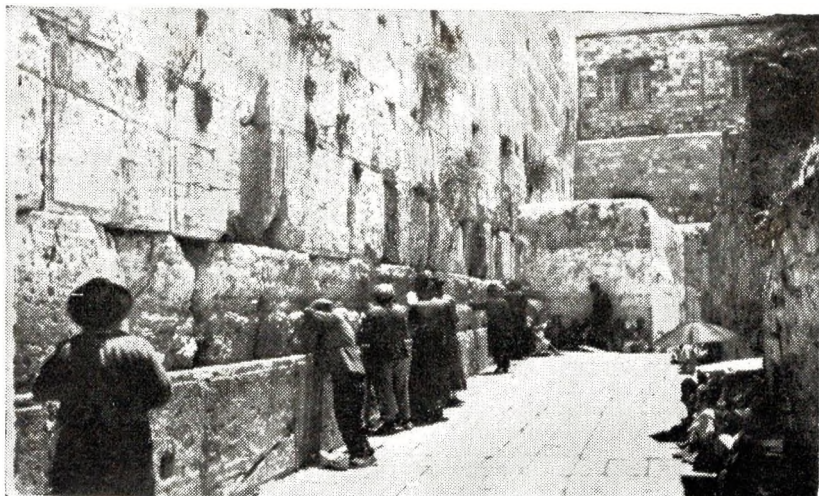
Moger ar C'hunuc'hennoù e Jeruzalem