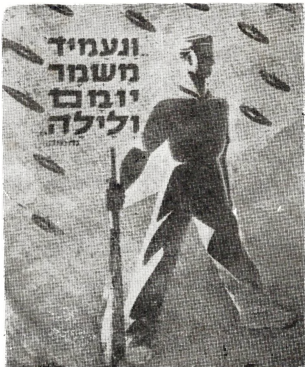
« Deiz ha noz e vezomp war evezh » (Nehemia). Skritell-embann evit arme Israel