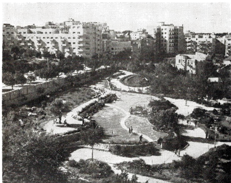
Ace ne ca, lanter-kant vloaz zo, nemet traezh. — Tel Aviv