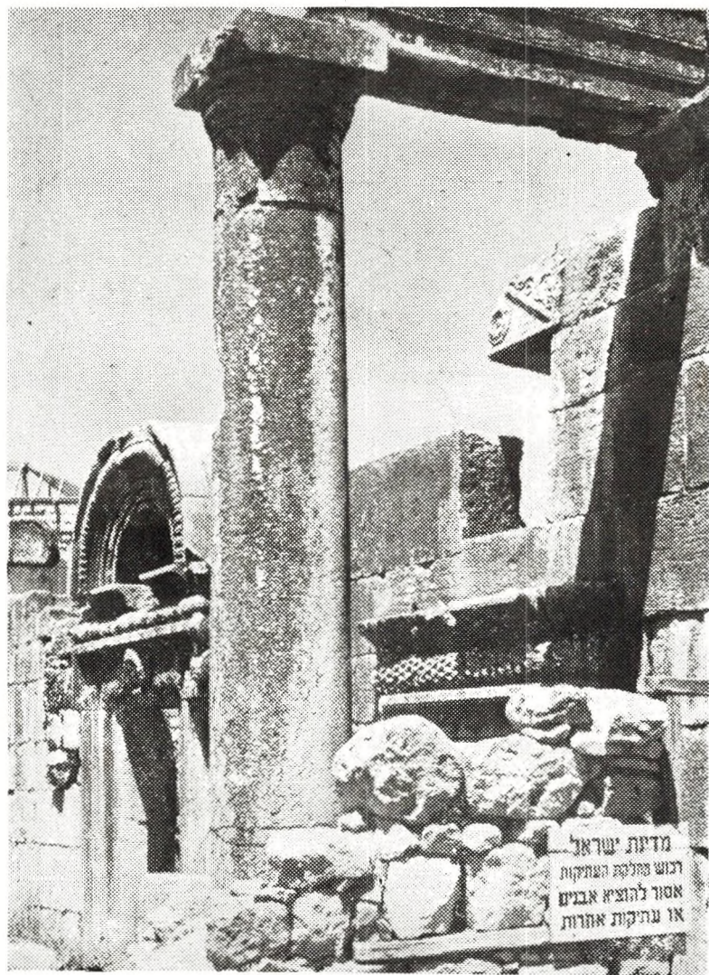
Dismantroù Kfar Nahoum, e-kichen lenn Tiberiadez