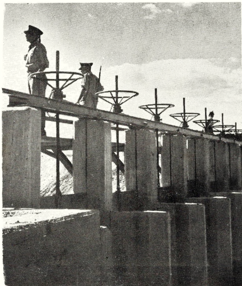
E tracaienn an Houle : an dour a zo bukez Israhel