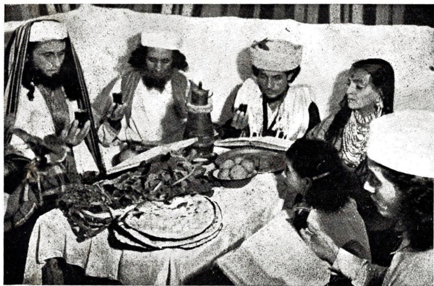
Yuzevien eus ar Yemen o tebrifñ, gant lid, pzed Fask