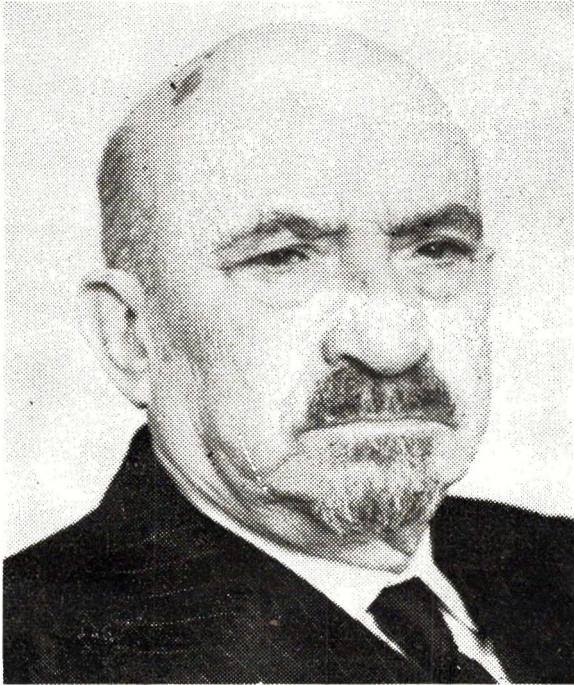
HAIM WEIZMANN (1873-1952) rener kentañ Israhel