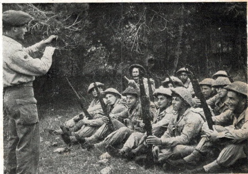
Soudarded Israhel o devez o deskadurezh en hebreeg