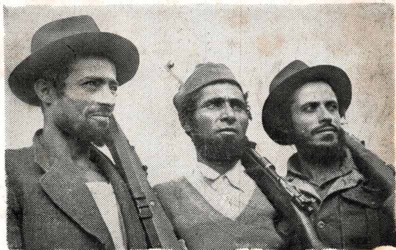
Soudarded a-youl vat : Yuzevien eus ar Yemen