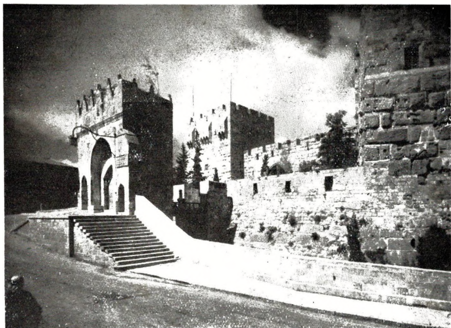
Tour David e Jeruzalem