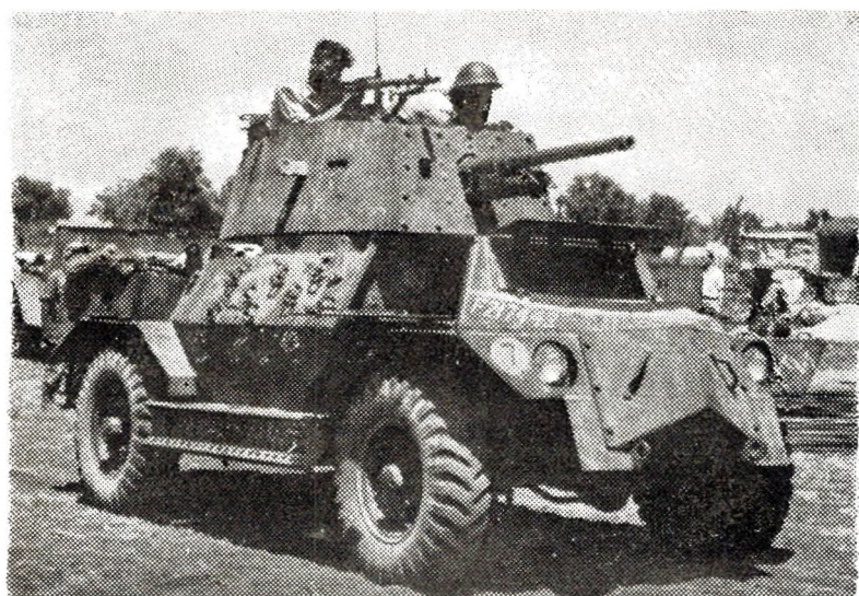
Arme nevez Israel